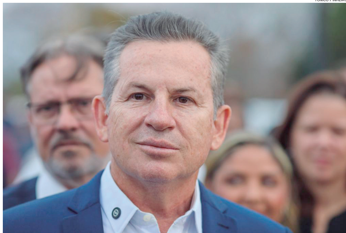
Levantamento diz que cerca de 82% da população aprovam a condução do governo

Na avaliação do próprio governador, o desempenho positivo está diretamente relacionado à execução de um plane-