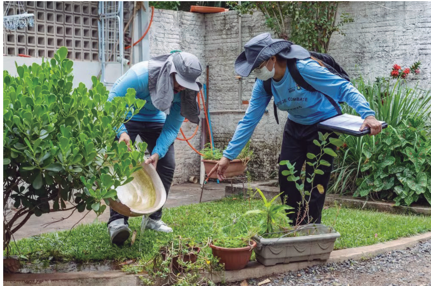
Com um início de ano marcado por indicadores elevados e histórico recente de surtos, Cuiabá enfrenta o desafio de conter a proliferação do mosquito e evitar uma nova escalada de casos.

Levantamento aponta 70% dos bairros com índice elevado de infestação do mosquito transmissor