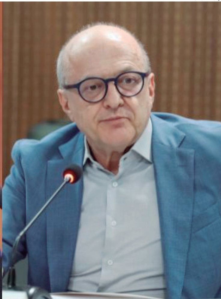
Briga de Gigantes irá movimentar a disputa ao Palácio Paiaguás em 2026

é desgastar a imagem do adversário antes mesmo do início oficial da campanha.