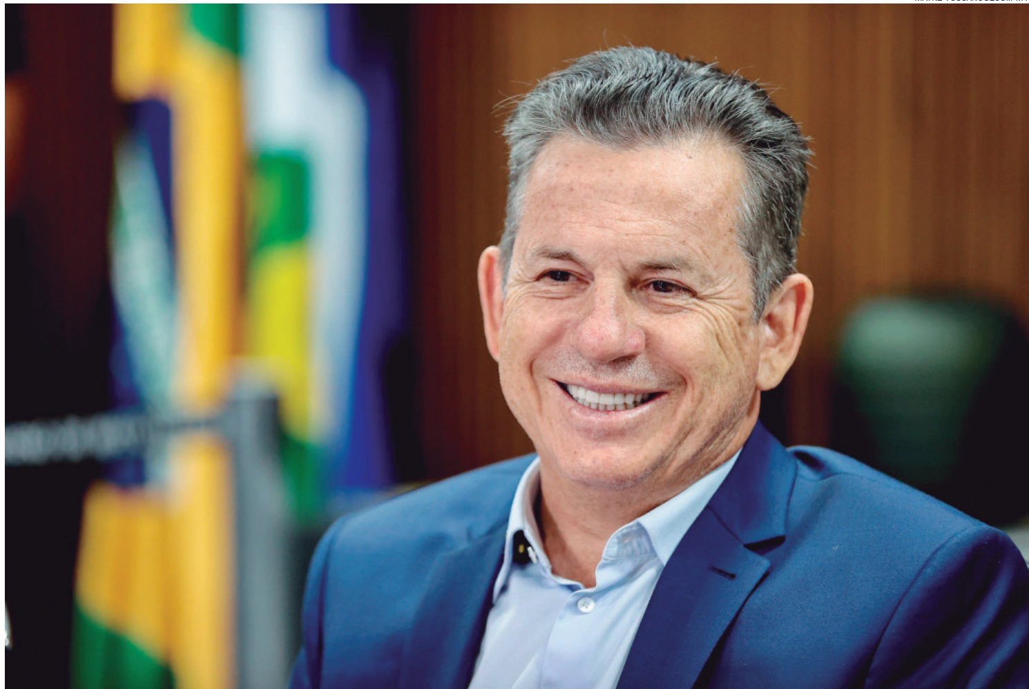
Nos bastidores, a leitura é de que Mendes conseguiu construir um arco de alianças sólido, reduzindo riscos

A avaliação positiva do governo e o reconhecimento de obras estruturantes em diferentes regiões do Estado contribuem para esse cenário, mantendo o governador distante, ao menos por ora, de turbulências po-