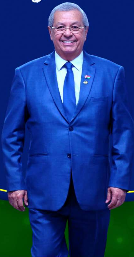
SENADOR Jayme Campos

Centro Oeste Popular: Além da representatividade, a senhora defende políticas públicas de igualdade racial. Quais iniciativas a senhora considera essenciais para avançar nessa agenda?