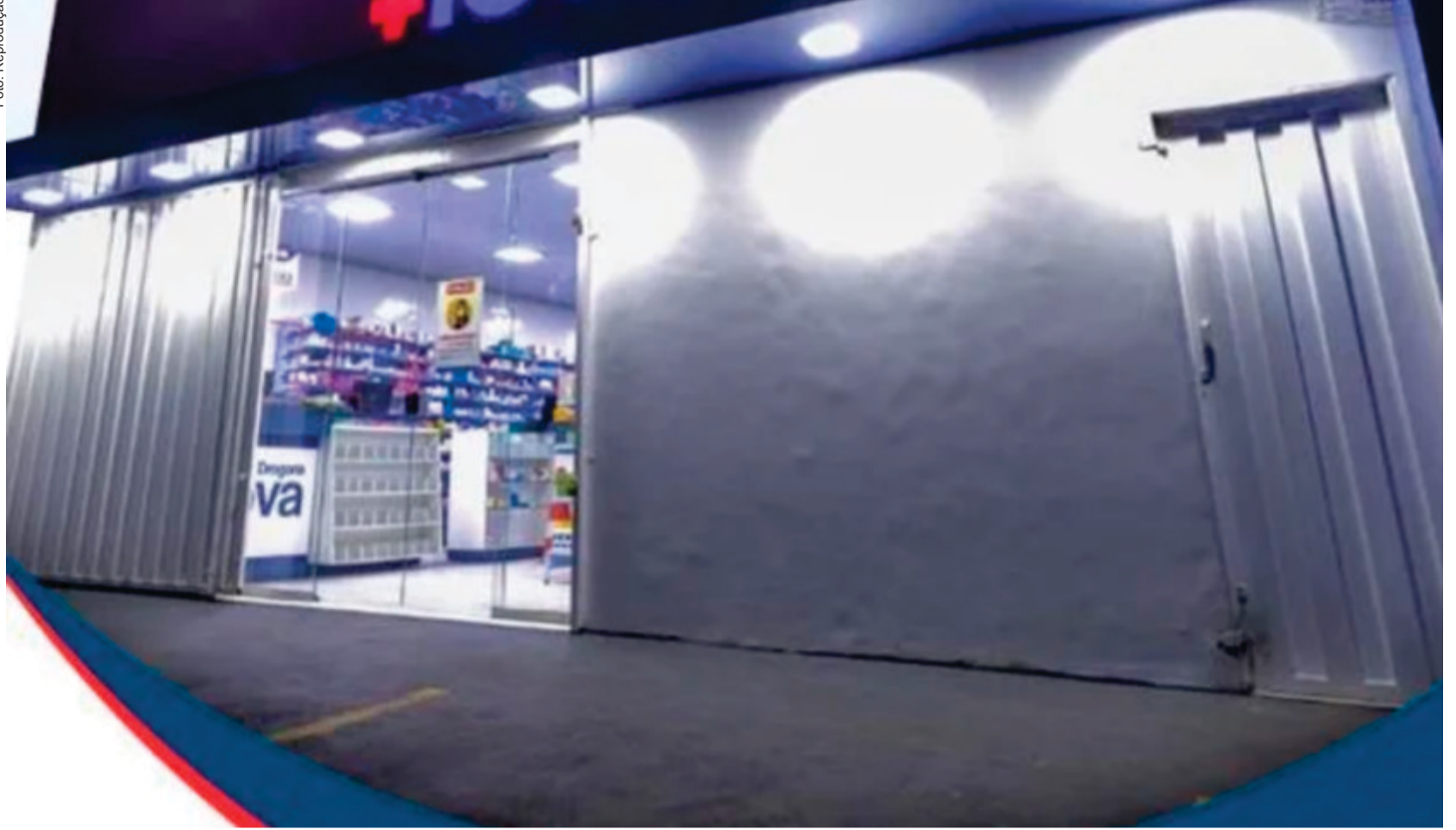
Apesar da gravidade dos fatos, fontes ligadas ao setor apontam que a denúncia pode não avançar devido à influência do dono da drogaria

Apesar da gravidade dos fatos, fontes ligadas ao setor apontam que a denúncia pode