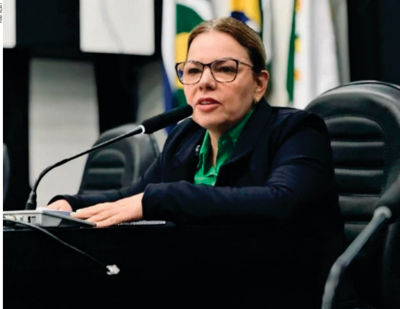
Sobre a recondução de parlamentares afastados por decisão judicial, a presidente explicou que a Casa já tem conhecimento do posicionamento do tribunal