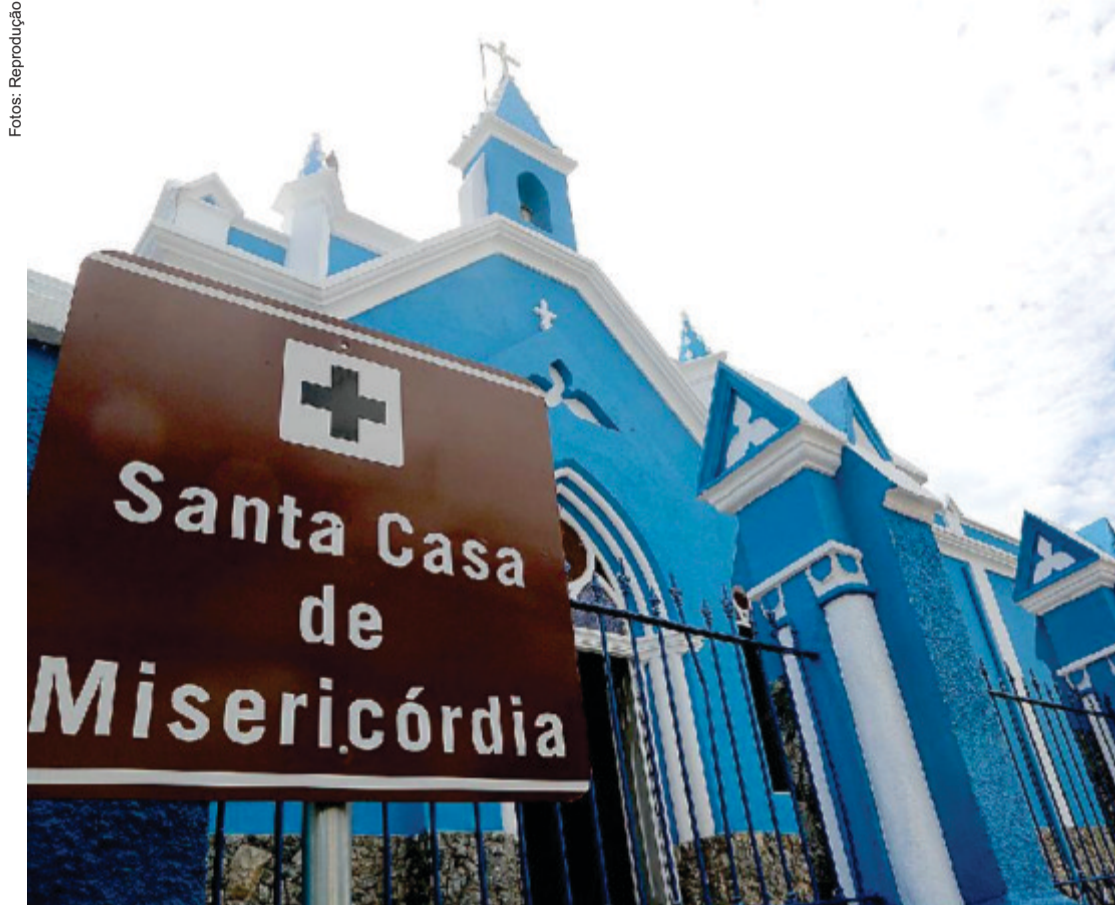
O colapso da Santa Casa teve início em março de 2019, quando a instituição anunciou o fechamento das portas após acumular uma dívida trabalhista milionária e atrasos salariais de até sete meses

Na prática, a Santa Casa foi incorporada à rede estadual de saúde, embora o prédio e o patrimônio tenham continuado sob responsabilidade da instituição filantrópica original. O passivo financeiro logo se tornou objeto de centenas de ações na Justiça do Trabalho. Segundo o Tribunal Regional do Trabalho de Mato Grosso (TRT-MT), mais de 860 processos foram movidos contra a instituição. Destes, 384 já foram encerrados mediante o pagamento de R$ 7,3 milhões, en-