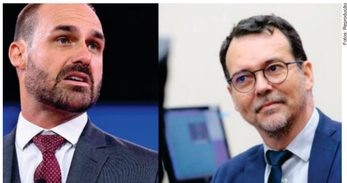
Lúdio ainda classificou a atuação de Eduardo Bolsonaro fora do Brasil como prejudicial aos interesses nacionais, acusando-o de agir contra o país e seus cidadãos

Parlamentar critica pedido de Eduardo Bolsonaro para manter mandato morando nos EUA e repudia discursos de anistia a golpistas