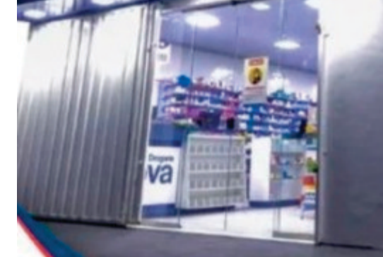
O caso em Cuiabá ocorre em um momento de expansão acelerada do mercado farmacêutico. Dados da consultoria IQVIA revelam que o Brasil é o terceiro maior consumidor de medicamentos por meio digital no mundo

O caso em Cuiabá ocorre em um momento de expansão acelerada do mercado farmacêutico. Dados da consultoria IQVIA revelam que o Brasil é o terceiro maior consumidor de medicamentos por meio digital no mundo, atrás apenas dos Estados Unidos e da Alemanha. Em 2024, mais de 5,4 mil novas farmácias foram abertas no país, o que representa uma média de 22 inaugurações por dia. O setor movimentou R$ 58,3 bilhões entre janeiro e julho, segundo a Abrafarma.