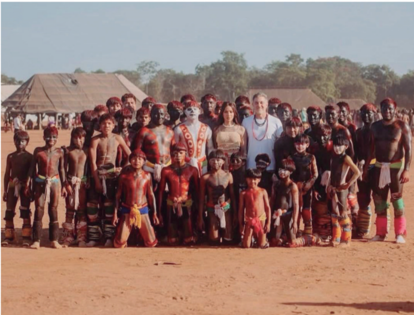
A CANTORA ANITTA E O APRESENTADOR LUCIANO HUCK, VISITA TERRITÓRIO INDÍGENA DO XINGU, EM MATO GROSSO, NO ÚLTIMO FIM DE SEMANA, E SE ENCONTRARAM COM RAONI METUKTIRE, DE 88 ANOS, UMA DAS MAIORES LIDERANÇAS INDÍGENAS DO BRASIL E REFERÊNCIA INTERNACIONAL NA DEFESA DA AMAZÔNIA E DOS POVOS ORIGINÁRIOS.

Frases A natureza deve ser vista e respeitada é ela que nos matem vivos. Autor desconhecido