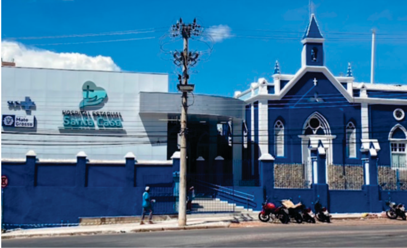
Caso o hospital seja arrematado por uma instituição de saúde privada, o governo será o primeiro a contratar seus serviços para garantir o atendimento aos pacientes