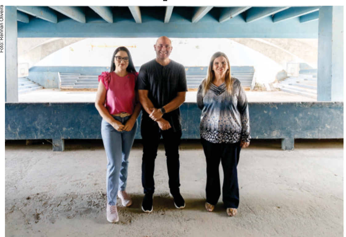
O prédio histórico será adaptado para oferecer serviços nas áreas de saúde, educação, esporte e lazer, ampliando o suporte às famílias e fortalecendo políticas públicas inclusivas