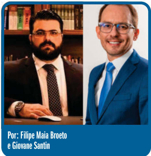
Por: Filipe Maia Broeto e Giovane Santin

“ A suspensão de processos penais e, com ela, do prazo prescricional é atividade que viola frontalmente o princípio da legalidade, porquanto estabelece causas suspensivas inexistentes no plano legislado, com base em fundamentos meramente utilitaristas, escolhidos ao livre talante do Poder Judiciário ”