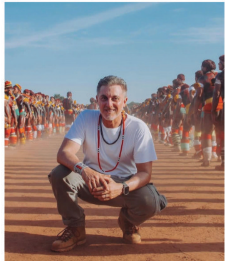
O APRESENTADOR LUCIANO EM UMA VIVÊNCIA MAIS QUE ESPECIAL