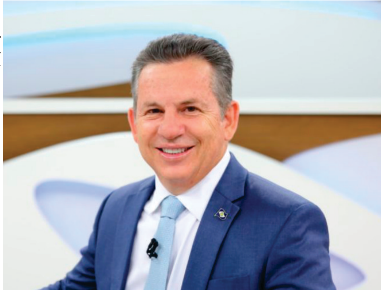
À frente do Executivo estadual desde 2019, Mendes herdou um estado em crise: com salários atrasados, fornecedores sem receber e obras paralisadas

Um dos principais marcos da gestão é o programa de infraestrutura, considerado o maior já realizado no estado. Foram mais de 3 mil quilômetros de rodovias pavimentadas, revitalizadas ou em obras, além de pontes, aeroportos regionais e obras estruturantes em dezenas de municípios.