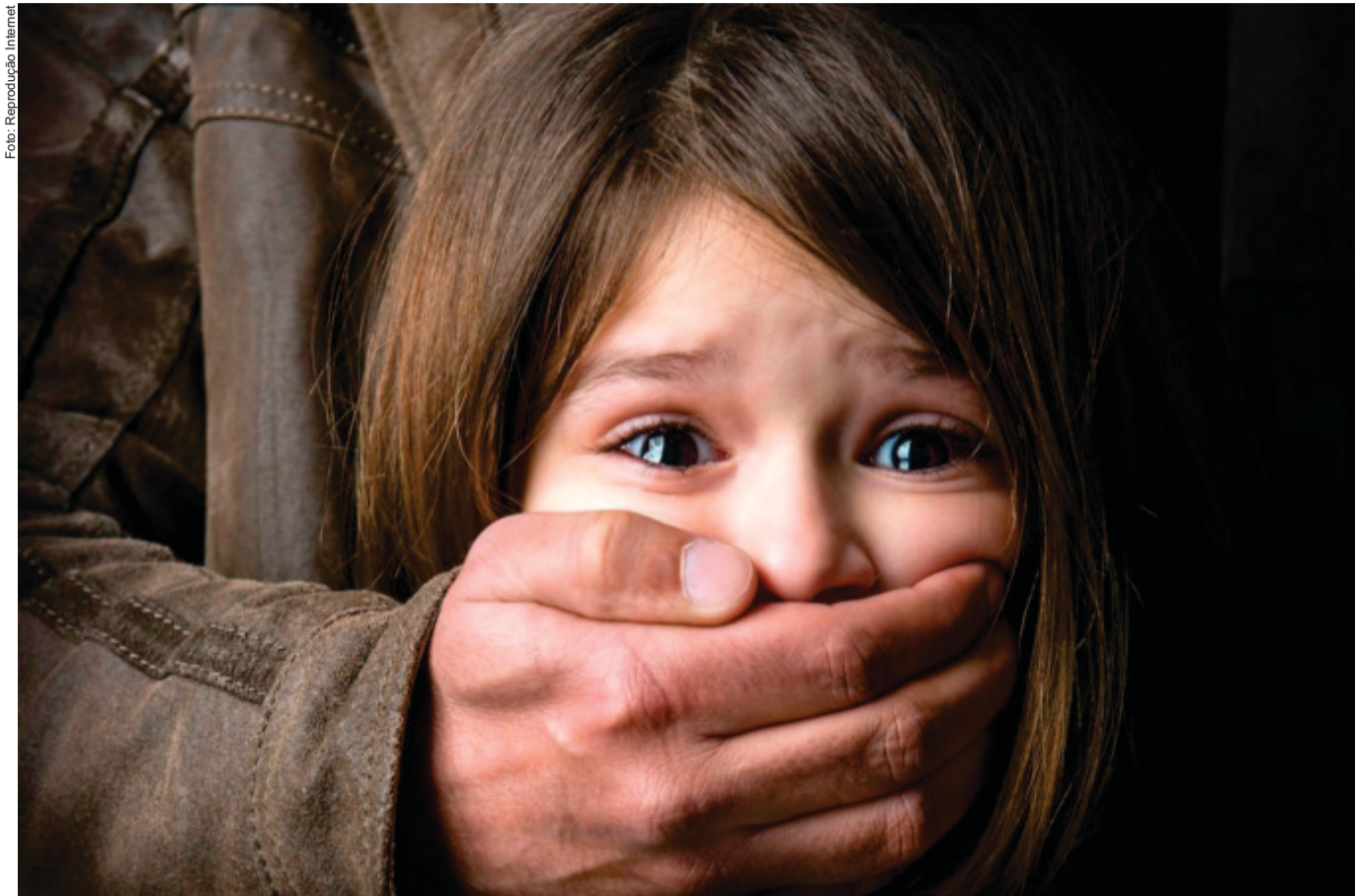
A exposição precoce de menores à erotização, somada à falta de regulação das plataformas digitais, está diretamente ligada ao aumento de casos de violência sexual infantil

As consequências foram imediatas: o presidente da Câmara dos Deputados, Hugo Motta, anunciou que vai pautar projetos para proteger crianças nas redes sociais; a deputada Érika Hilton reforçou a denúncia junto à Polícia Federal; e o deputado Nikolas Ferreira declarou que Felca "mexeu no vespeiro". Em Cuiabá, o vereador Rafael Ranalli apresentou projeto de lei com foco em proibir a produção e divulgação de conteúdos que configurem sexualização ou adultização de crianças e adolescentes, com multas que variam entre R$ 126 mil e R$ 1,26 milhão, além de suspensão de atividades e cassação de alvará. Esse projeto