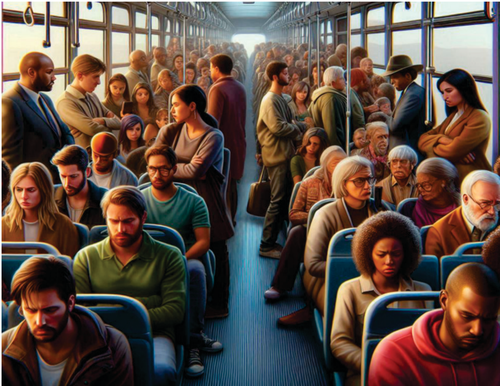
Imagem: Criada por Kleber Simioni com recursos de IA da Microsoft Designer

Em casos de violência, acidentes ou falhas graves no trajeto, o passageiro deve registrar boletim de ocorrência e buscar orientação jurídica especializada. Também é possível acionar o Procon, o Ministério Público, a Defensoria Pública ou até mesmo ingressar com uma ação judicial pedindo in-