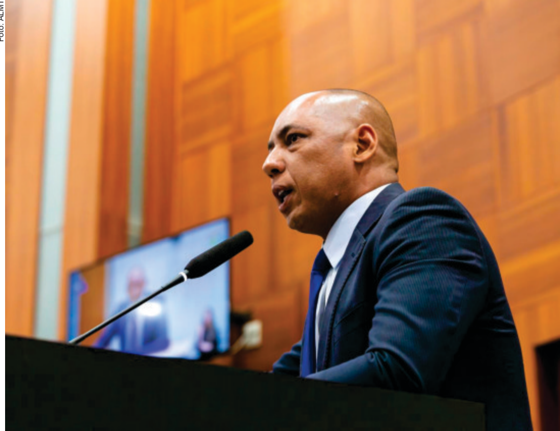
Sobre a disputa ao Governo do Estado, Juca informou que ainda não há definição, mas que o MDB segue dialogando com outras siglas

"Entro nessa nova fase com humildade, com a mesma paixão por servir e com a firme convicção de que, sob as bênçãos de Deus e com o apoio do povo, podemos avançar ainda mais", declarou.