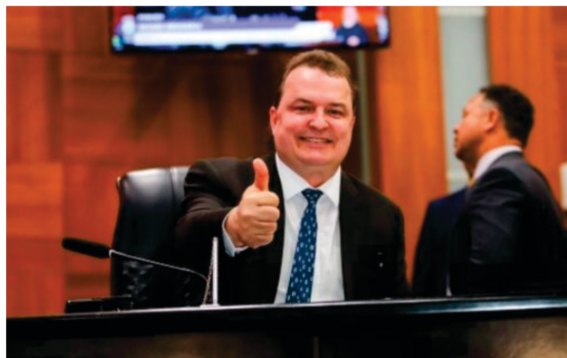
A gestão de Max Russi tem se pautado por ampliar a transparência, modernizar os processos da Casa de Leis e acelerar a tramitação de projetos de interesse público

Presidente da Assembleia Legislativa tem se destacado pela articulação política, fortalecimento de pautas sociais e compromisso com o desenvolvimento do estado