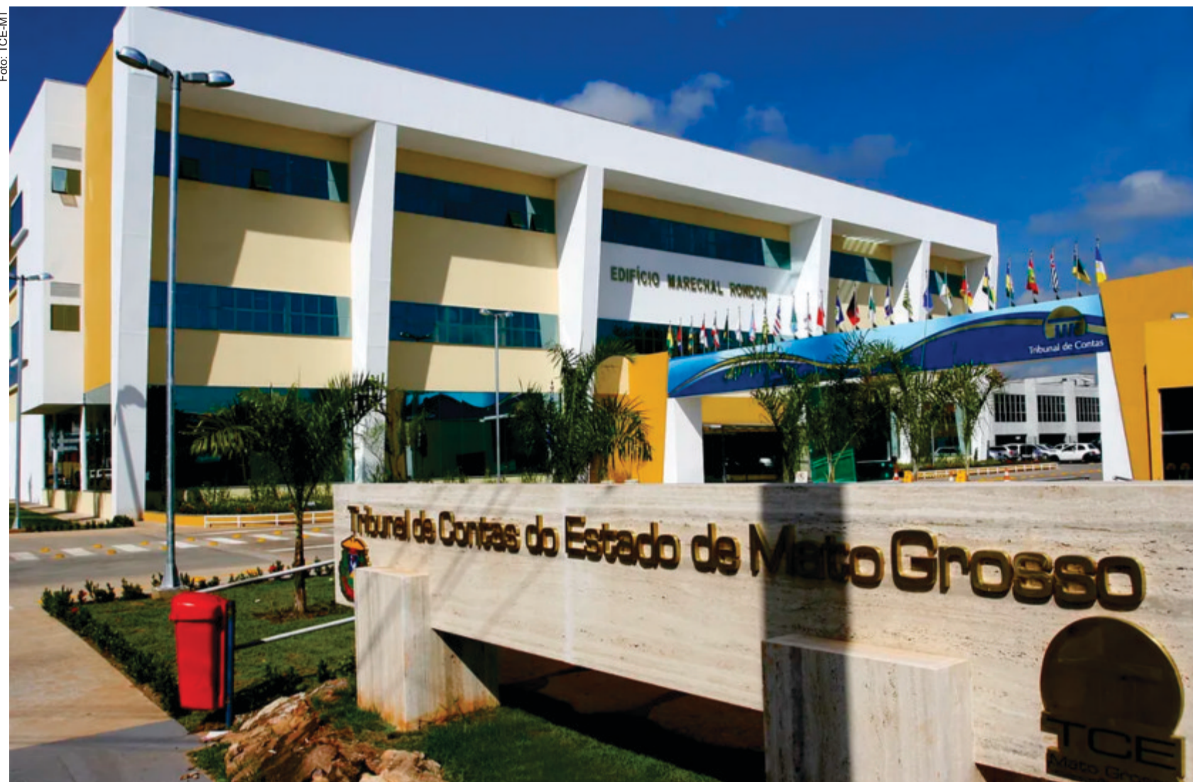
O objetivo do projeto é reduzir um déficit de 12 mil vagas e consolidar o programa na Lei Orçamentária de 2025, garantindo ambientes seguros e adequados para o desenvolvimento das crianças

O objetivo do projeto é reduzir um déficit de 12 mil vagas e consolidar o programa na Lei