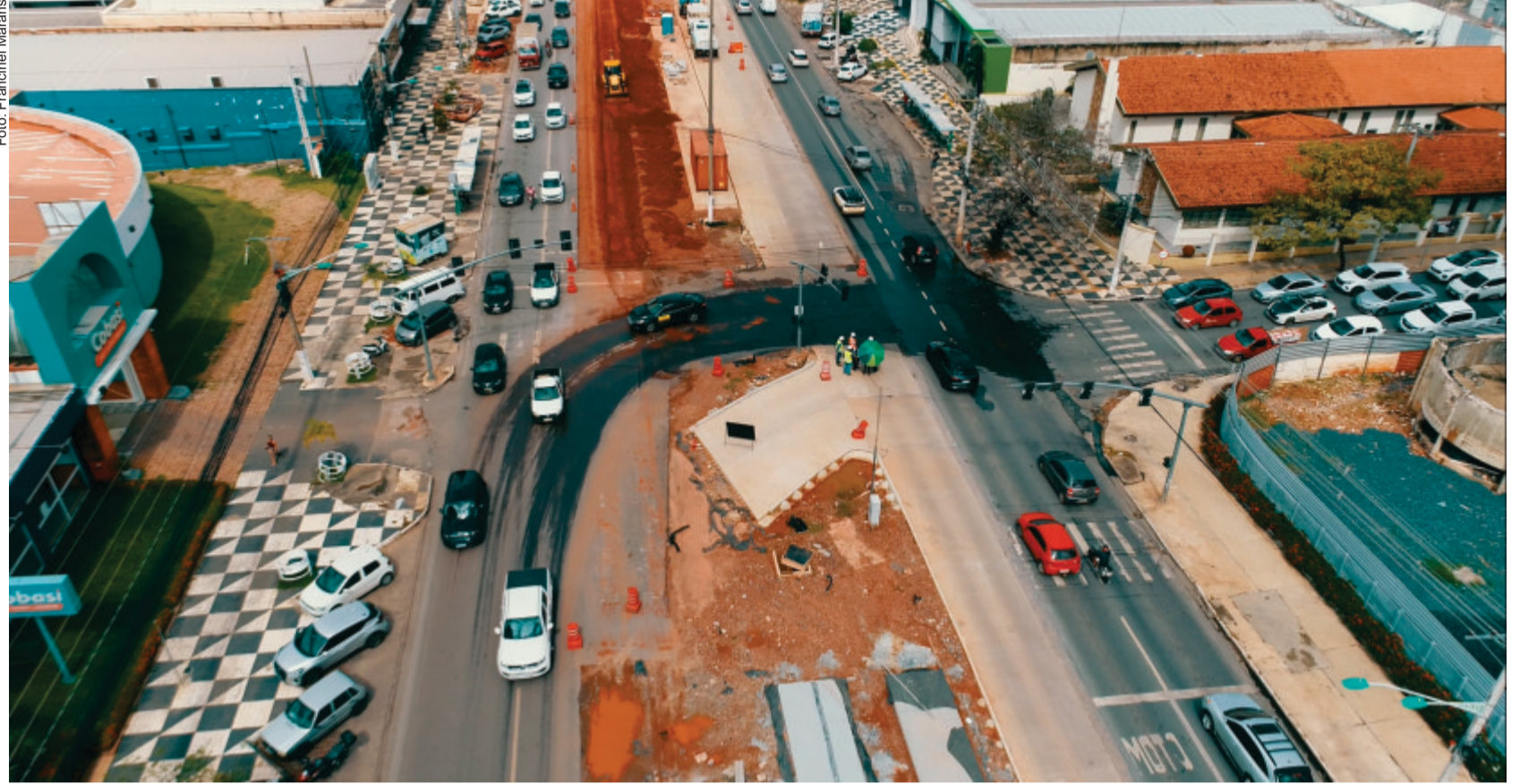
O principal motivo do atraso, de acordo com a pasta, foi o volume excepcional de chuvas registrado em Cuiabá entre março e abril deste ano, que ultrapassou o dobro da média histórica

O principal motivo do atraso, de acordo com a pasta, foi o volume excepcio-