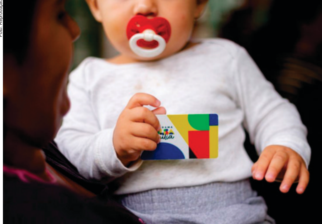
Apesar da redução no número de beneficiários, o investimento federal no estado segue elevado. Em julho, o governo repassou cerca de R$ 157,5 milhões para as famílias mato-grossenses

Segundo o governo federal, os principais motivos para os cortes foram o aumento da renda familiar, o encerramento do prazo da chamada Regra de Proteção e a intensificação do cruzamento de dados para validação cadastral. A Regra de Proteção permitia que famílias que ultrapassassem temporariamente o limite de renda per capita continuassem recebendo parte do benefício por até