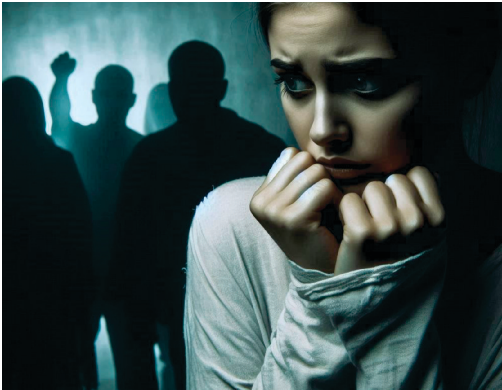
Imagem: Criada por Kleber Simioni com recursos de IA da Microsoft Designer

E não são apenas os juízes ou legisladores. A falha começa lá na base, na esquina, na delegacia da cidade e principalmente na educação. Delegados que tratam denúncias com desdém, policiais que debocham da vítima, perguntando “tem certeza que foi isso mesmo?” ou sugerindo que “você