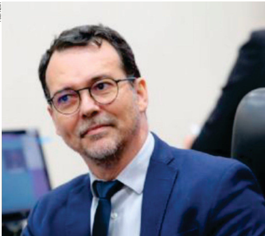
O deputado estadual e médico Lúdio Cabral (PT) fez críticas contundentes à condução da saúde no estado e à postura do secretário Gilberto Leite

Diante desse cenário, o deputado estadual e médico Lúdio Cabral (PT) fez críticas contundentes à condução da saúde no estado e à postura do secretário Gilberto Leite. Em entrevista,