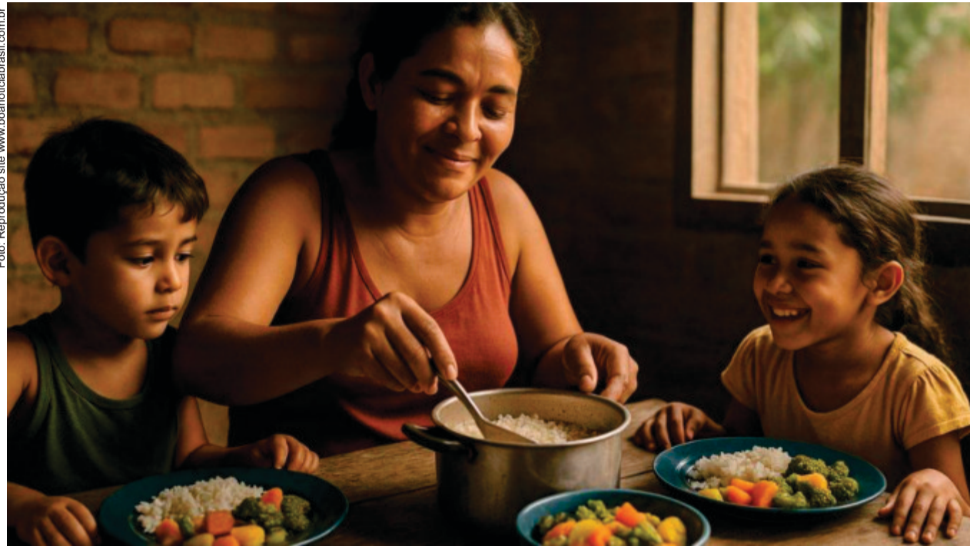
Segundo o IBGE, cerca de 24 milhões de pessoas deixaram a condição de insegurança alimentar grave entre 2022 e 2023. Em 2023, o país reduziu a pobreza extrema para 4,4%, retirando quase 10 milhões de pessoas dessa situação em comparação com 2021

Segundo dados do IBGE, com base na Escala Brasileira de Insegurança Alimentar (EBIA), cerca de 24 milhões de pessoas deixaram a condição de insegurança alimentar grave entre