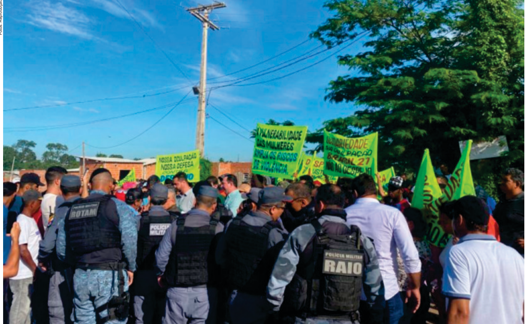
De acordo com a lei, os ocupantes devem deixar o imóvel em até 24 horas após o recebimento da notificação. A ação deve ocorrer de forma pacífica, mas, em caso de resistência, o uso da força policial está autorizado

A nova lei foi criada em resposta ao aumento dos conflitos por posse de terra no estado e busca agilizar os processos de reintegração, que tradicionalmente dependem de decisões judiciais demoradas. Diferentemente da Lei nº 12.430/2024, que previa sanções administrativas e foi anulada pelo Supremo Tribunal Federal por invadir competências da União, a Lei nº