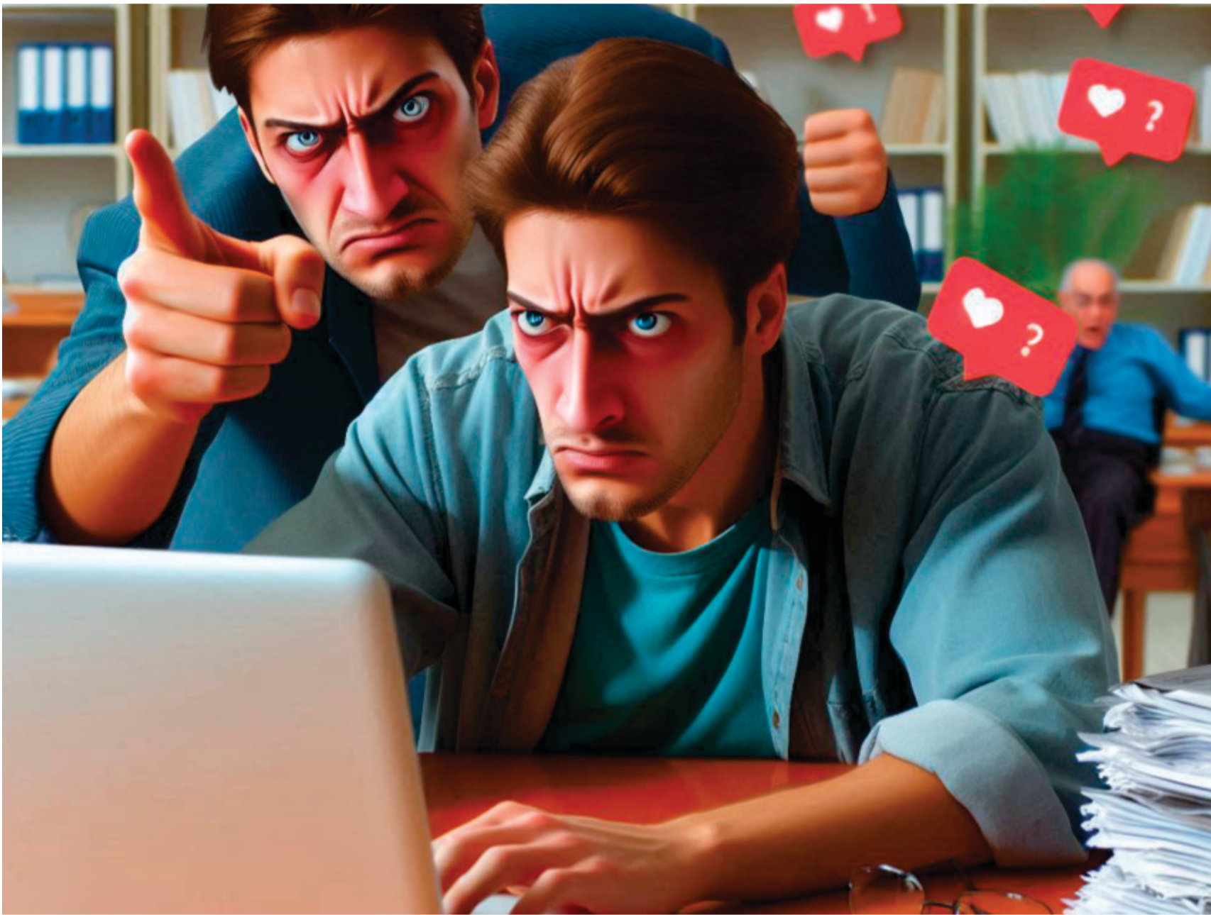
Imagem: Criada por Kleber Simioni com recursos de IA da Microsoft Designer

É nesse contexto que se insere a decisão judicial que condenou Léo Lins. Suas falas não apenas ofendem a dignidade humana, como representam uma afronta à memória histórica e à ordem jurídica democrática. Em seus discursos, o humorista tenta replicar um modelo importado dos Estados Unidos onde podcasts e conteúdos humorísticos gozam de maior permissividade legal. Contudo, o Brasil não é os Estados Unidos. Aqui, os direitos fundamentais, como a dignidade da pessoa humana e a igualdade, têm peso constitucional e formam cláusulas pétreas.