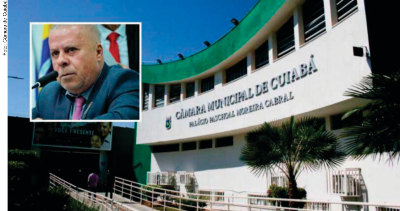
A operação foi deflagrada após a obtenção de novos elementos que, segundo fontes da investigação, confirmam a materialidade dos crimes