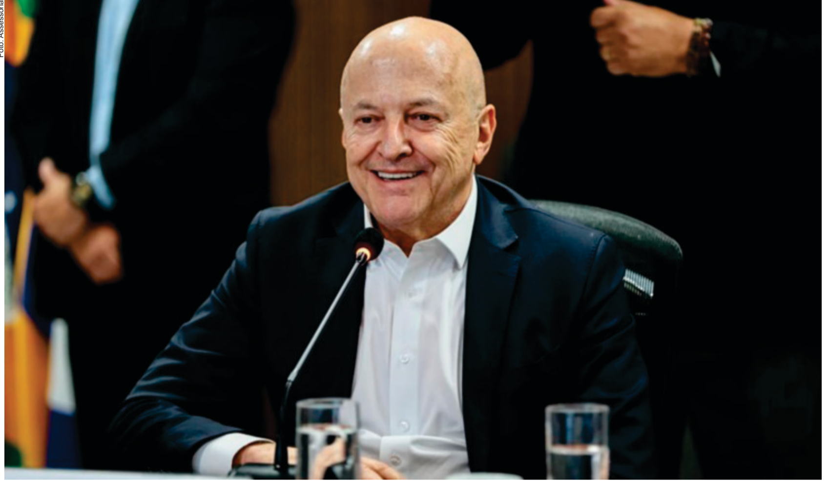
Questionado sobre um possível apoio de Mauro Mendes a uma eventual candidatura sua ao governo, Pivetta destacou que sempre teve disposição para seguir na vida pública, mas não se ilude com o cenário político

Em relação ao senador Jayme Campos (União), Pivetta afirmou que mantém diálogo constante. “Jayme é meu vizinho e conversa-