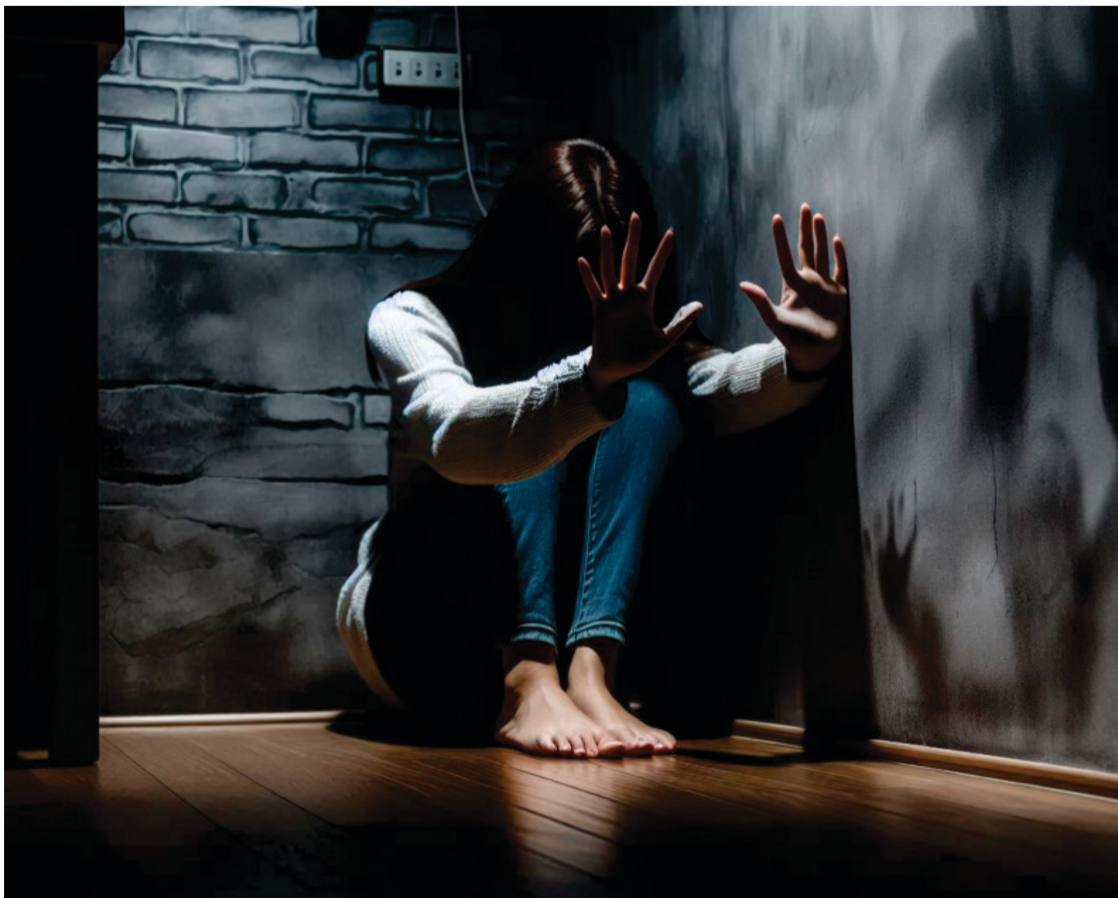
Imagem: Criada por Kleber Simioni com recursos de IA da Microsoft Designer

Este é o caso da Lei nº 14.717/2023, que garante uma pensão especial no valor de um salário-mínimo para filhos e dependentes menores de 18 anos de mulheres vítimas de feminicídio, desde