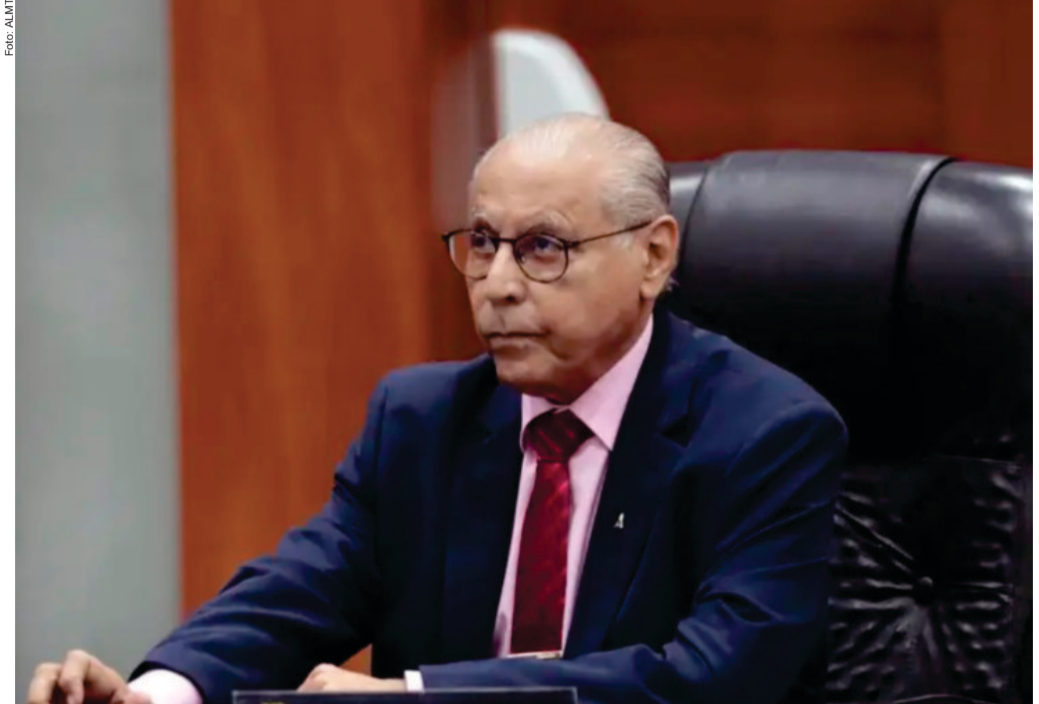
No cenário nacional, o deputado comentou os desdobramentos da política econômica e diplomática entre Brasil e Estados Unidos, especialmente diante do aumento das tarifas americanas sobre produtos brasileiros e da discussão sobre anistia aos envolvidos nos atos de 8 de janeiro

No cenário nacional, o deputado comentou os desdobramentos da política econômica e diplomática entre Brasil e Estados Unidos, especialmente diante do aumento das tarifas americanas sobre produtos brasileiros e da discussão sobre anistia aos envolvidos nos atos de 8 de janeiro. Júlio alertou para os impactos das divergências ideológicas entre os presidentes Lula e Trump, defendendo o protagonismo do Itamaraty na busca por equilíbrio comercial.