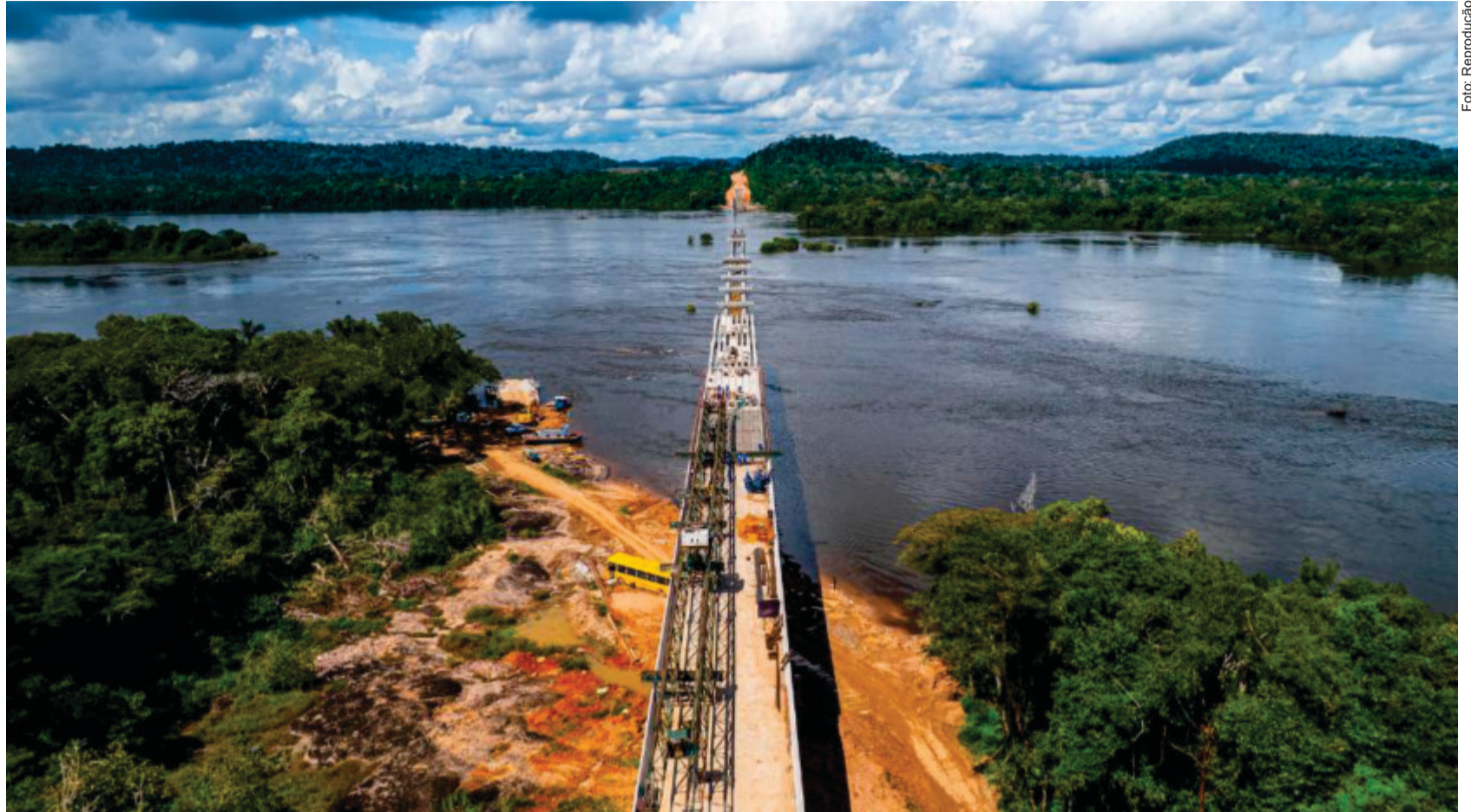
A ponte substituirá a travessia por balsa, que hoje pode levar até uma hora e representa alto custo, especialmente para veículos pesados, com tarifas que chegam a R$ 400 por viagem

Para o governador Mauro Mendes, a obra é emblemática. "A ponte do Rio Juruena vai ligar Cotriguaçu a Nova Bandeiran-