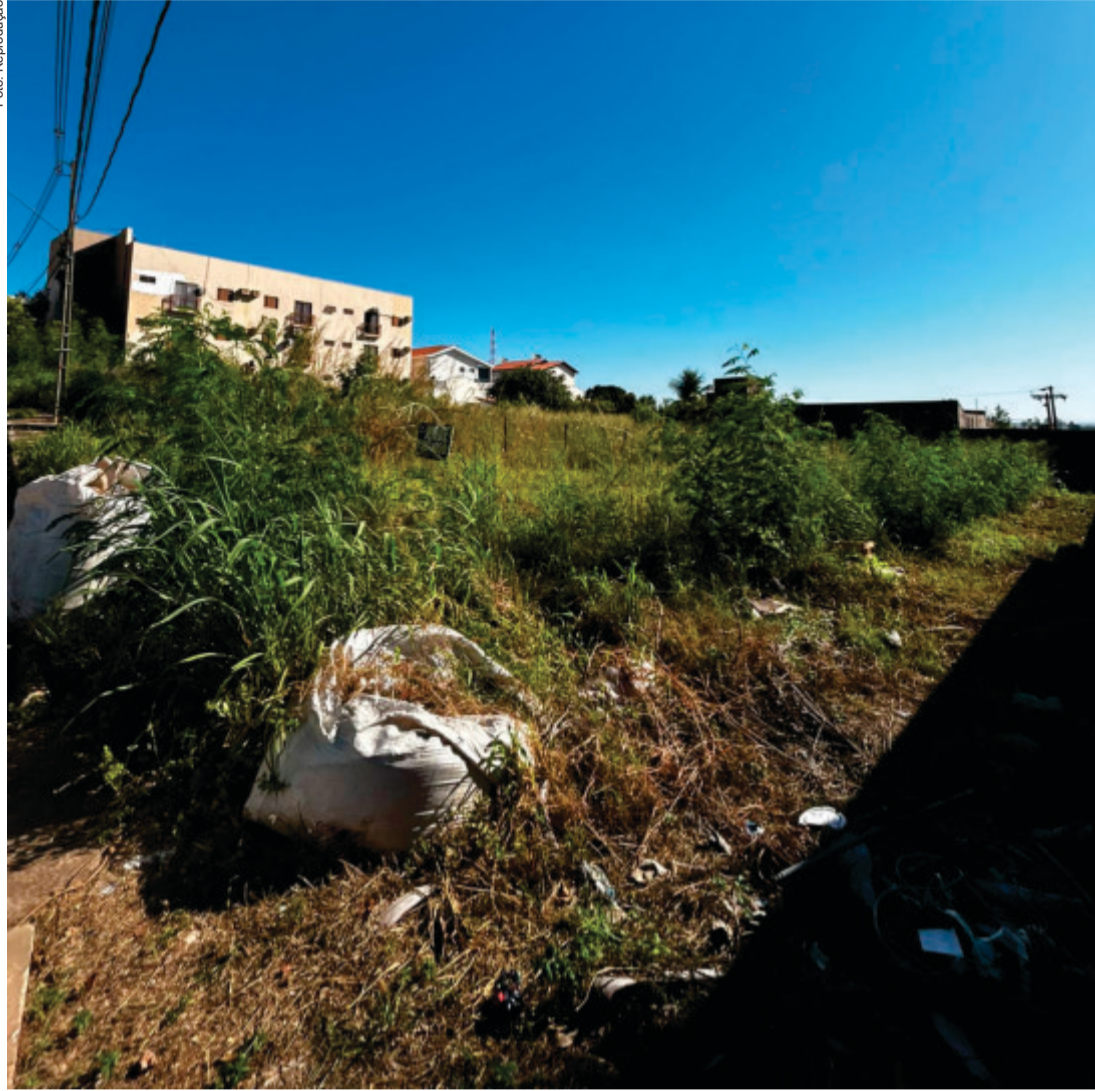
A preocupação com os terrenos baldios se justifica: eles representam riscos à saúde pública, segurança e ao meio ambiente. O acúmulo de lixo e mato alto favorece a proliferação de vetores de doenças como dengue, leptospirose e chikungunya, além de atrair roedores e insetos

nico Fiscal do Cidadão Cuiabano (DEC-Fiscal), eliminando a necessidade de entrega física de notificações. Segundo Abílio, a nova legislação moderniza a fiscalização, amplia a agilidade dos processos e está alinhada à Lei Federal nº 14.129/2021, que institui o Governo Digital. A implantação do sistema já começou, com